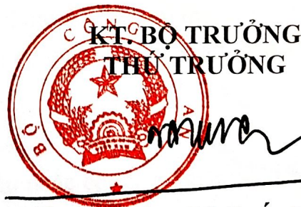
Trung tướng Lê Quốc Hùng